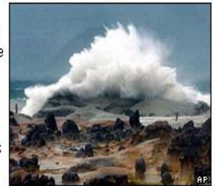
El calentamiento de los océanos provoca una marea más alta.

Nueva información presentada a la Asociación estadounidense para el Avance de la Ciencia revela que la temperatura de los océanos del planeta ha aumentado debido a los cada vez más altos niveles de gases de invernadero.