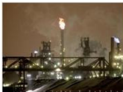
Waste gases burn as smoke and steam belch from the steel mills in Hamilton, south...

U.N. climate panel says warming is man-made