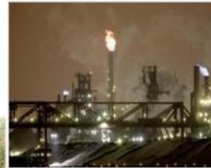
Waste gases burn as smoke and steam belch from the steel mills in Hamilton, south...